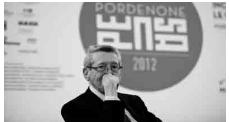
L'editorialista del Corriere della Sera Sergio Romano ha acceso il dibattito sulla crisi europea e l'austerità politica