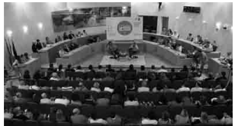
Sala gremita per assistere all'incontro con Carlo Cracco, il masterchef che ha fatto da giudice nell'omonima seguitissima trasmissione televisiva