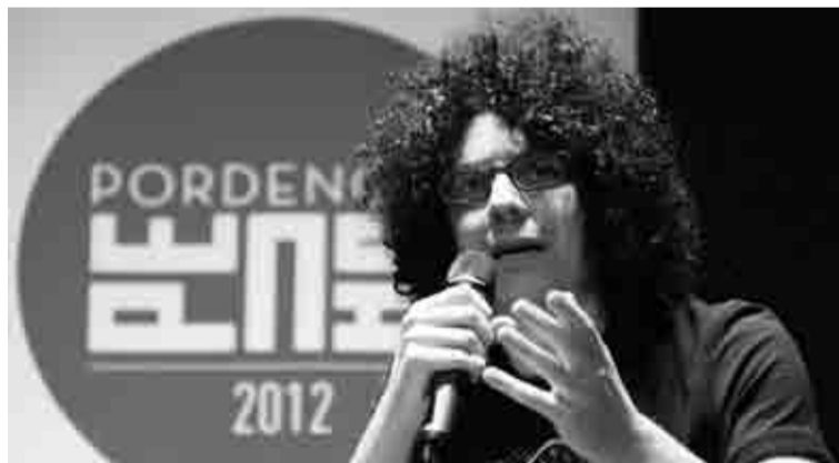
Il pianista e compositore Giovanni Allevi, interprete di un'intervista/concerto che ha entusiasmato il pubblico