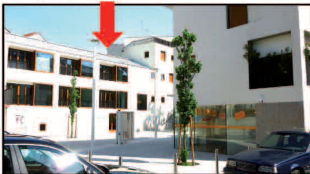
Oratorio S. Giorgio