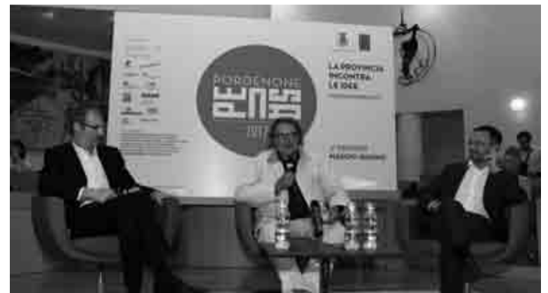
Il celebre fotografo Oliviero Toscani, intervistato dai Fotomaniaci, a ruota libera sul mondo della comunicazione, della grafica e delle arti visive